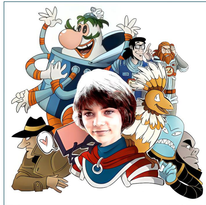
Алиса в путешествии

К сожалению, мы перестали слышать «голос из прекрасного далёка». Нас убедили, что Коммунизм – не Светлое Будущее, а тоталитарный режим при Сталине, что это тупиковый путь, нужно разрушить всё советское и сделать, «как на Западе». Мы отреклись от своей мечты, что стало одной из причин распада СССР и всей